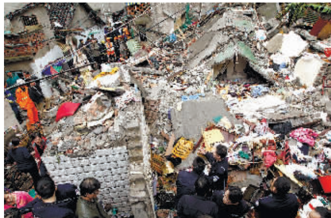
5月4日,消防官兵和公安民警在事故现场实施救援。

记者从虹口方面确认,居民口中的“戴队长”确有其人,目前已被公安机关控制。然而,拆迁人如何变身“大房东”?“违建房”又怎能逃过监管被继续出租使用?这些问题还有待相关部门尽快给出答案。 ■据新华社