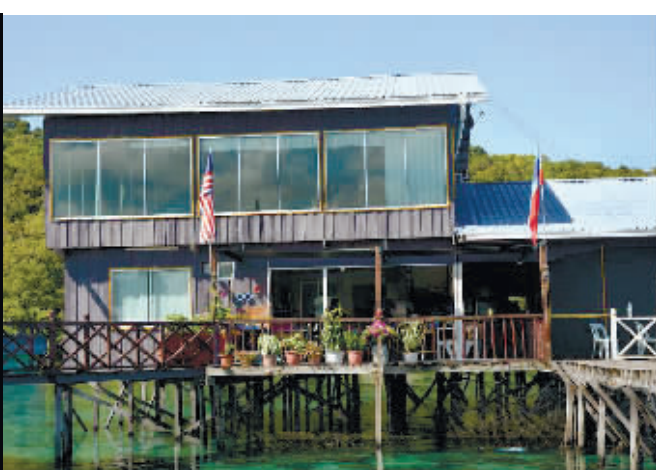
马来西亚沙巴州警方发布的发生绑架案地点照片。

中国驻马来西亚古晋总领馆6日说,马来西亚警方证实,一名中国公民当天在马来西亚沙巴州遭绑架。 马来西亚警方指认来自菲律宾南部的武装人员制造这起绑架事件。