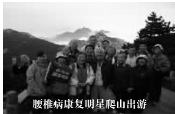
腰椎病康复明星爬山出游

更难以置信的是,这些神奇的变化源于一种腰椎病新药—郭忠镒丸。现在,长沙市已有数万多腰椎病患者体验