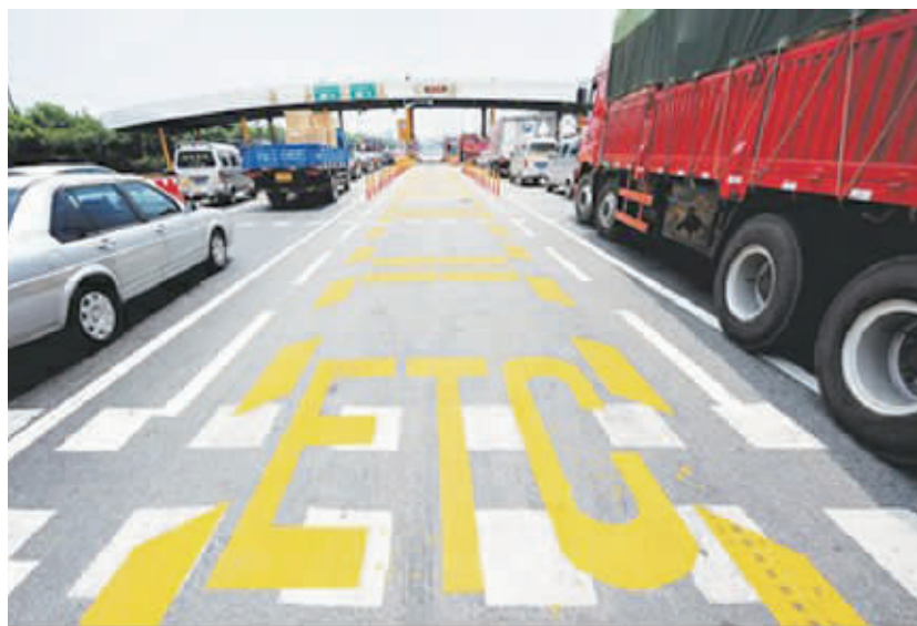
装有ETC的车辆可以“秒过”高速公路收费站。