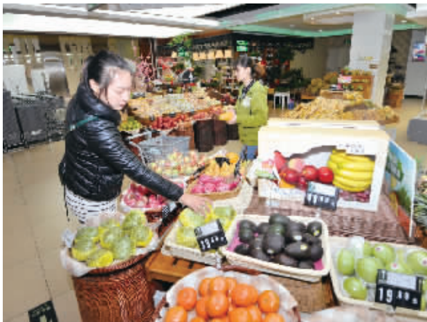
4月21日,长沙家润多悦方店,市民在选购水果。

不过,长沙消费者的“捧场”热度依然不减。多个商家表示,进口水果销量十分可观,168元/斤的智利车厘子单店日销40斤以上。长沙市场上的进口水果为什么这么贵?愿意以高价去买水果吃的究竟是哪些人?记者展开了相关调查。