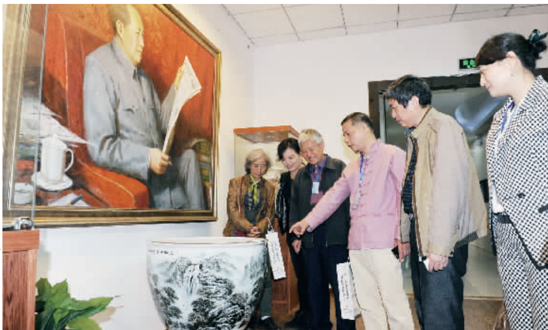
4月10日，联合国文化产权交易所在长沙揭牌，图为来宾品鉴该所艺术精品。