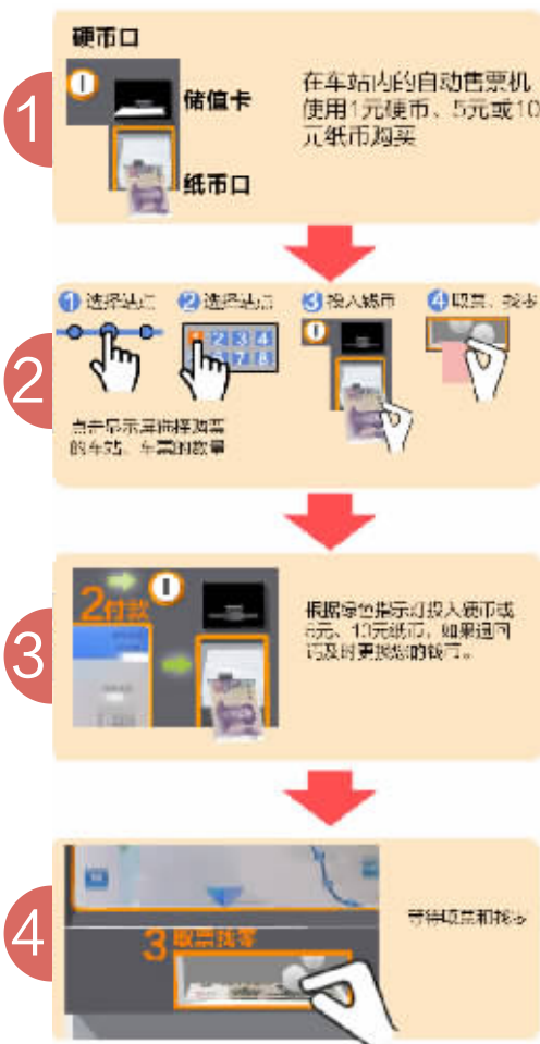
单程车票购买流程。 ■制图/杨诚、陈琼元