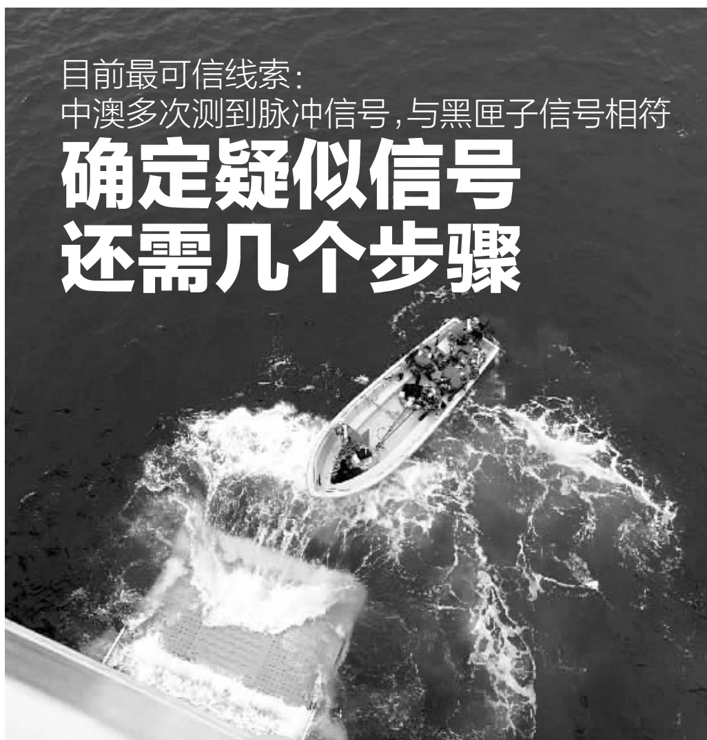
4月7日，海军井冈山舰派出冲锋舟进行搜索。