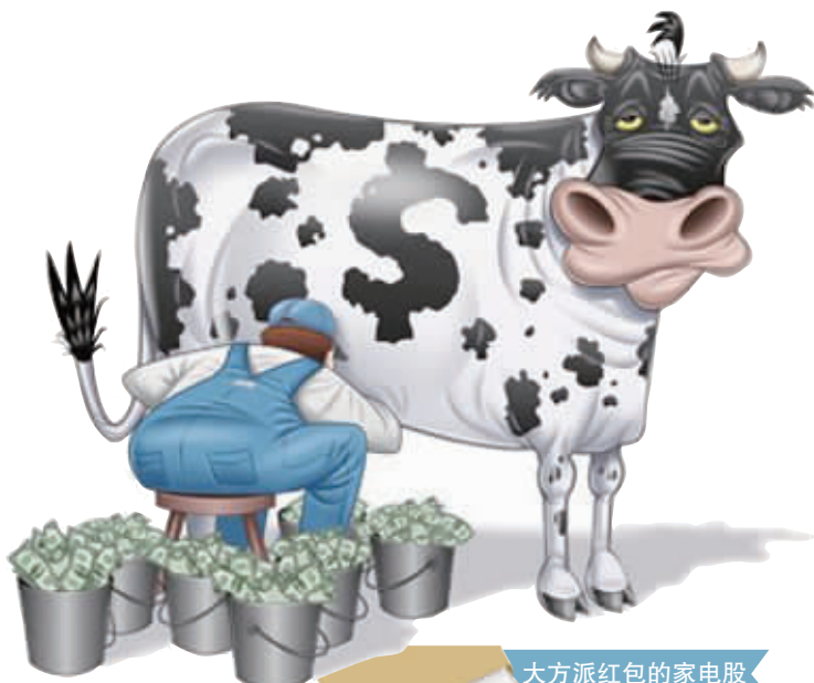
大方派红包的家电股

对此,国金证券高远分析指出,一方面证监会公布的鼓励分红措施,起到明显刺激作用,因而大多数上市公司有利就积极分红,甚至有的业绩下降也大方派红包。而家电企业,