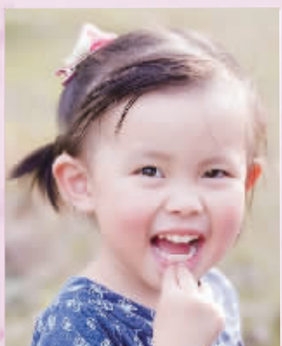
POPO 年龄:3岁 辣妈寄语: 你是妈妈心中最美的天使!