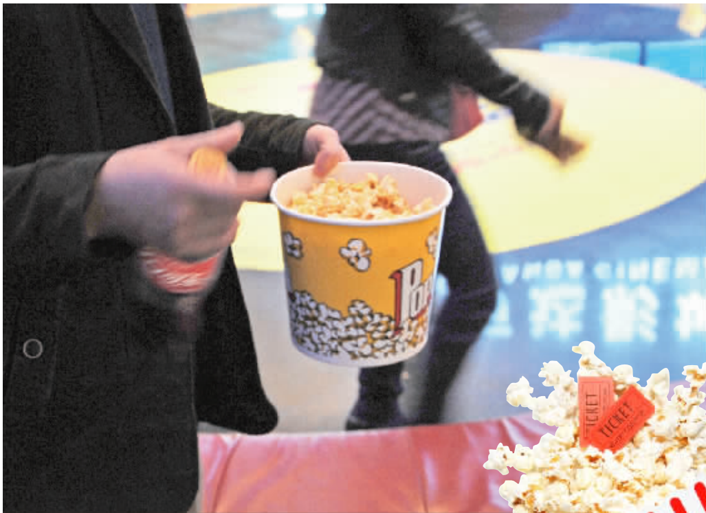
3月26日,长沙市万达影城解放路店,一位市民拿着一桶爆米花和可乐准备入场。

3月27日,三湘华声全媒体发起一则调查,发现32%的长沙观众每次去电影院都会买爆米花等零食,62%的观众偶尔会买一次。随后,记者走访了长沙多家商场的影院,来解读一下长沙影院里的爆米花经济学。