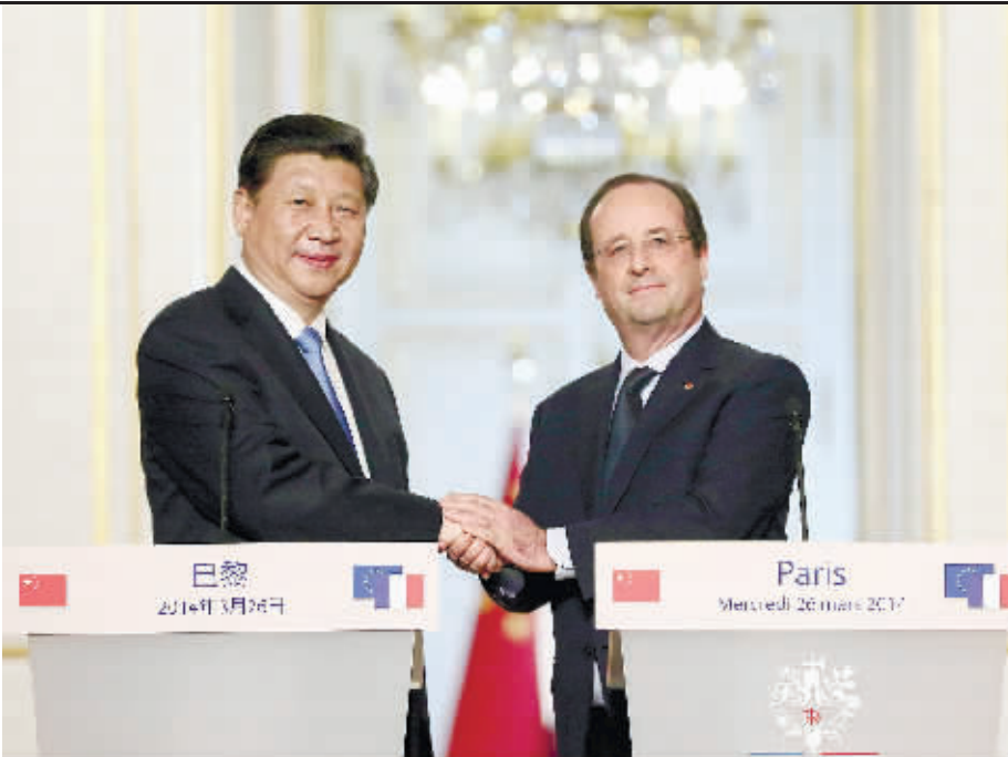
3月26日,国家主席习近平在巴黎与法国总统奥朗德共同会见记者。

来,法国对华展开“魅力外交”绝不仅是为了“面子”,更看重实实在在的经济利益,双方在汽车、航空、核能等领域准备的一系列大单是这次访问的“里子”。