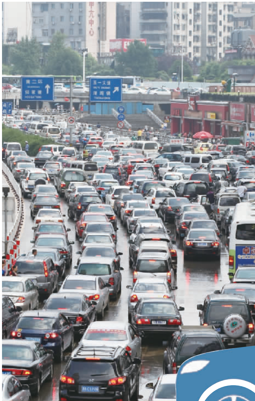
长沙市芙蓉路八一桥段密集的车流。(资料图片)