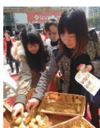
步步高商城在长沙高新区麓谷信息港举行当季水果试吃会,顾客络绎不绝

步步高商城物流负责人介绍,步步高集团在长株潭核心地带拥有中南最大物流园和成熟的物流