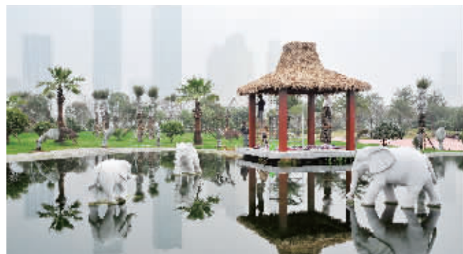
橘子洲沙滩体育休闲文化园将开园,将主打“樱花踏春”。