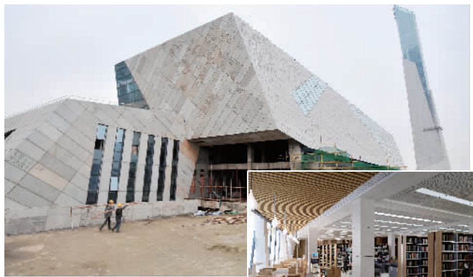
3月11日,长沙市新河三角洲两馆一厅工地,长沙市图书馆新馆已进入内部装修阶段,预计该馆今年年底可投入试运行。