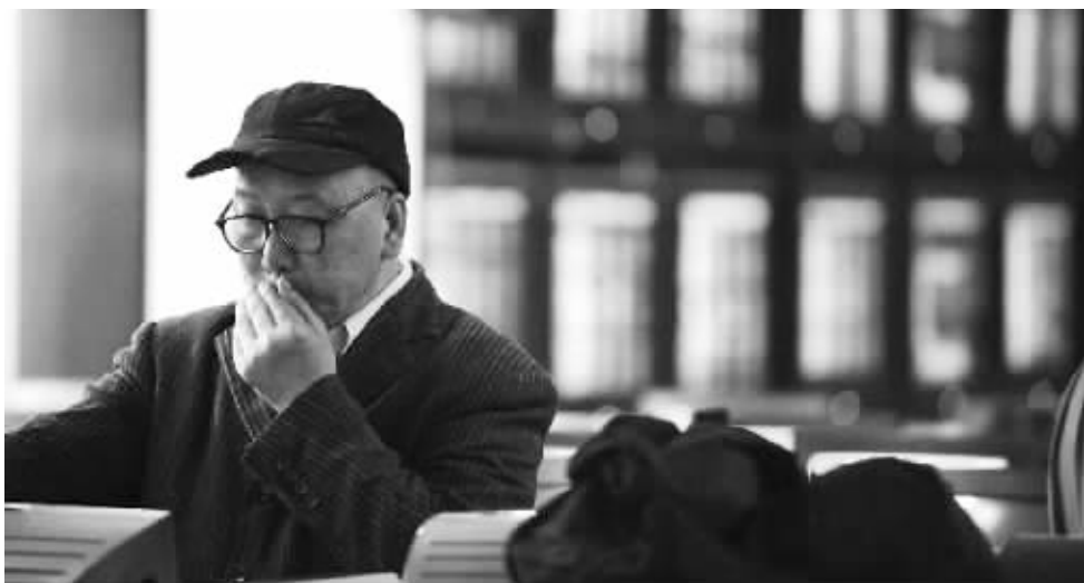
3月第一周,全球股市大跌又大涨,A股走势和国内股民却相对淡定。

随着俄罗斯的军事干预,近日乌克兰本已非常紧张的局面再度升级。出于对当前局势的担忧,本周初,大量投资者纷纷逃离股市转投黄金国债等避险品种,直接导致周一股市跌声一片。