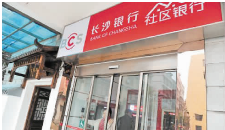
在长沙银行社区银行,居民可办理90%的金融业务。

办卡、理财、缴费……90%的金融需求能在家门口得到满足,长沙银行今年拟建100家