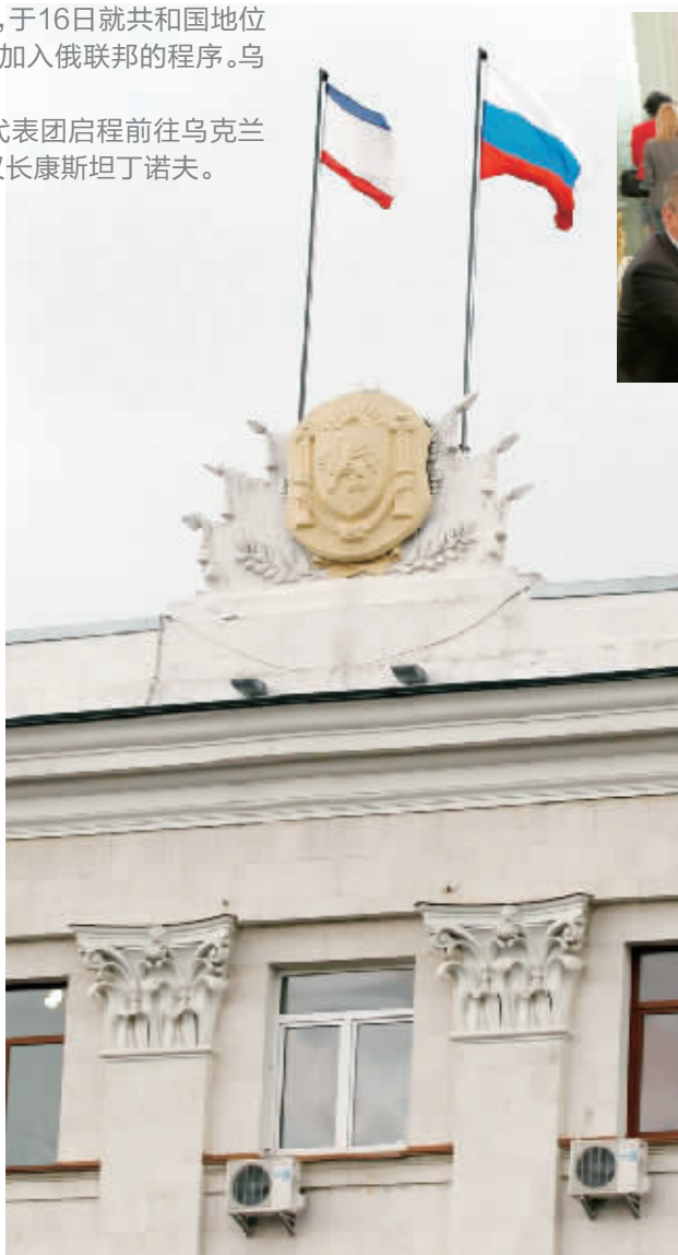
3月6日，在乌克兰克里米亚首府辛菲罗波尔，俄罗斯国旗（右）和克里米亚地区旗帜同时飘扬在政府大楼楼顶。

北约秘书长拉斯穆森在5日的北约-俄罗斯理事会会议后表示，北约将采取暂停联合军事行动和人际交流等制裁俄罗斯的措施。