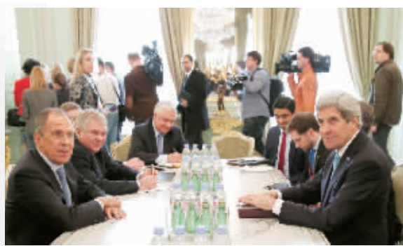
3月5日，在法国巴黎，俄罗斯外长拉夫罗夫（左一）和美国国务卿克里（右一）举行会谈。