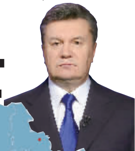
乌克兰总统亚努科维奇