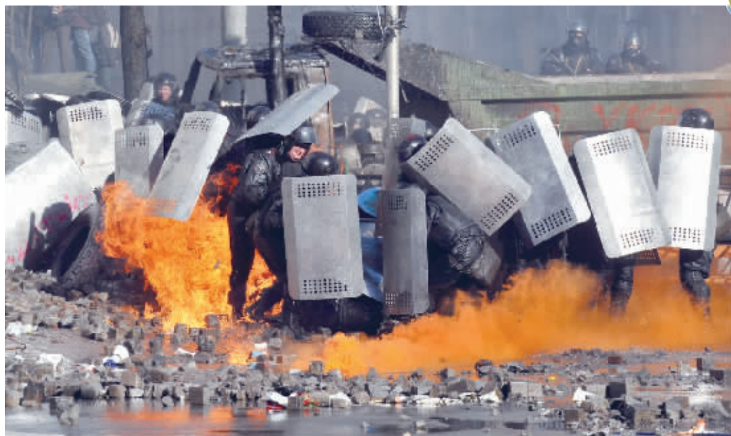
▲2月18日,在乌克兰首都基辅,防暴警察用盾牌抵挡示威者的攻击。

克利奇科的发言人说,克利奇科在午夜前赶往乌克兰总统维克多·亚努科维奇的办公室,希望解决这场危机。不过,数小时后,克利奇科证实与亚努科维奇的谈判失败。