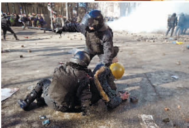
▼警察制服一名反对派示威者。