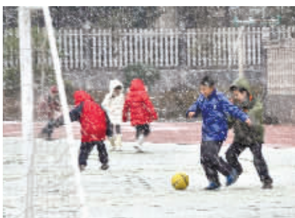
小学生冒雪在操场上踢球。