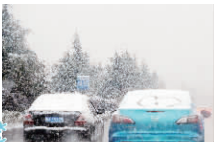
行驶中的车辆上覆盖着厚厚的积雪。