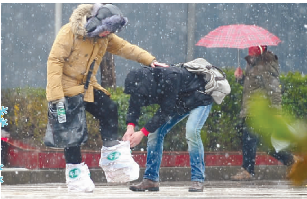
2月18日,长沙市黄兴北路,一位男子用塑料袋将女子的鞋子套上,防止进水。