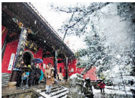
长沙麓山寺雪景。