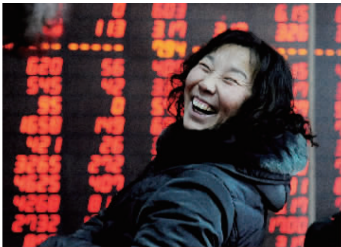
2月10日沪指放量大涨2.03%,一名股民笑逐颜开。

2月10日,马年第二个交易日,A股延续前一交易日走势,大幅反弹。沪深两市跳空高开,成交量出现了显著增长。创业板指数再度刷新历史高点,最高冲至1557.03点。网络股网宿科技再度走高,成功夺走贵州茅台第一高价股“宝座”。