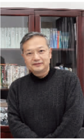
省教育厅党组书记、厅长王柯敏。