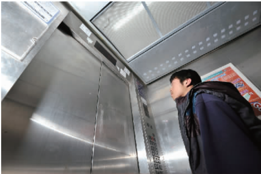
长沙市政协委员建议由市政府牵头成立电梯救援信息平台。图为1月9日,长沙湘江北路一楼盘,居民乘坐电梯上楼。