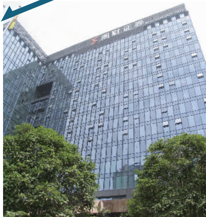
湘财证券长沙总部。

一张印着“湘财证券公开转让说明书”的A4纸张,即便是已经被折皱涂抹,刚“现身”于网络,就在资本界引发了一场大讨论:湘财居然要上新三板?这是什么节奏?