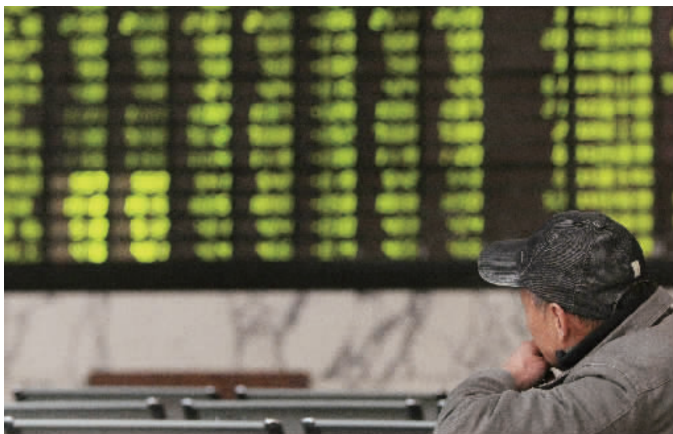
1月6日,沪深股市大幅下挫,全线板块飘绿。