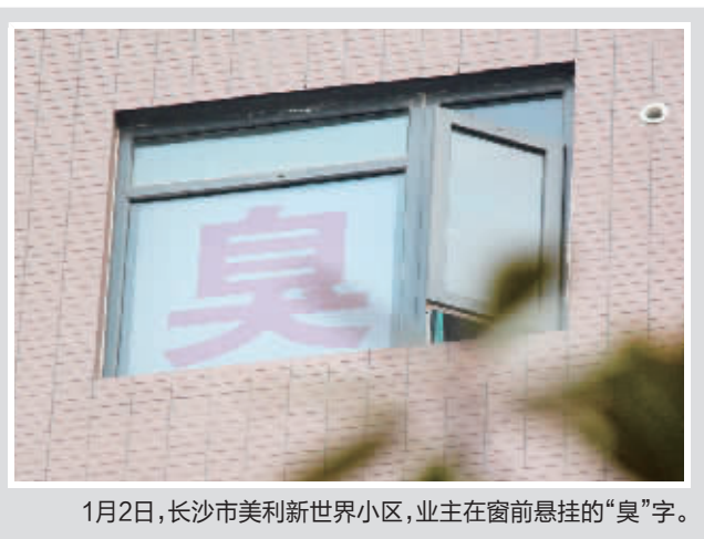
1月2日,长沙市美利新世界小区,业主在窗前悬挂的“臭”字。