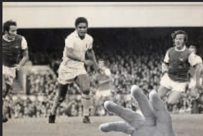
尤西比奥(中)在比赛中。