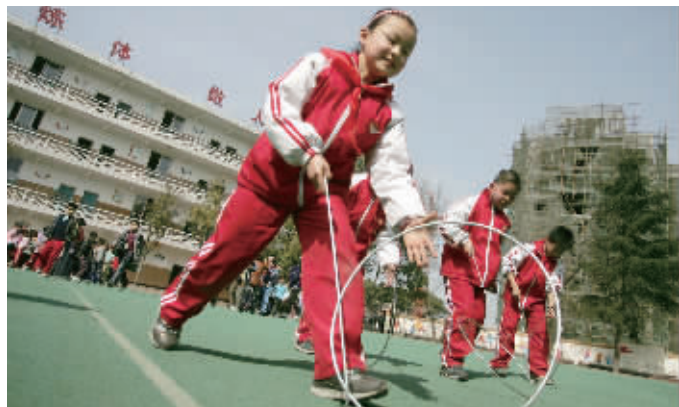
滚铁环是不老的游戏。(资料图片)

还记得小时候和伙伴们成群结队地追着铁环跑吗?儿时的你手中滚动的铁环是从哪里来的呢?还知道铁环应该怎样才能滚起来吗?1月5日,网友@函子文就为家里闲置的铁环而发愁,“家里的空间比较大,突发奇想带儿子像我小时候那样,兴致起了在家就滚滚铁环,结果筐瓢了。”