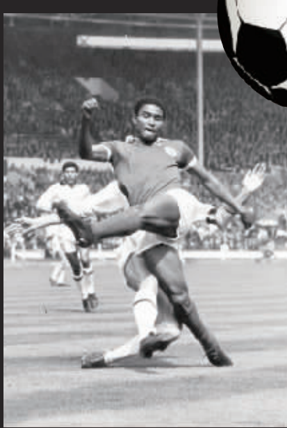
尤西比奥最经典的瞬间。