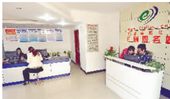
天心区芙蓉南路社区的工作人员在“E刻服务圈”回应居民的诉求。

务岗位等信息后，社区里这些不文明现象就少多了。“亮身份亮承诺后，在职党员从单位人转变为社会人，日常言行受到社区居民监督，所以不文明现象大幅减少。”