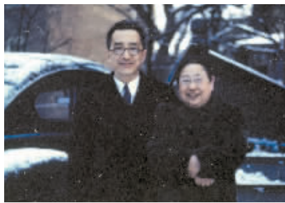
▲ 杨步伟与胡适在美国。

1934年，刘半农在外出考察时，患上了回归热加上误诊，不幸英年早逝。赵元任曾作挽联：“十载奏双簧，无词今后难成曲；数人弱一个，叫我如何不想他！”1981年，赵元任访问北京期间，多次被邀请唱这首歌。一次在音乐学院唱完这首歌后，学生提问：这是不是一首爱情歌曲？其中的“他”究竟是谁？赵元任回答说，这首歌词是刘半农在英国伦敦留学时写的，“他”可以是男的，可以是女的，也可以是指男女之外的其他事物，这个字代表一切心爱的他、她、它。