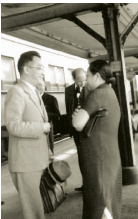
本版内容未经作者许可，不得转载。

▶ 1949年4月，胡适卸任北京大学校长一职，飞往美国，住在他卸职后纽约的一所公寓。这时的他情绪极其低落。此时在加州大学任教的赵元任将他接到家中住了几天，举办自助餐招待有关朋友和他见面。1956年初，赵元任联名十二名教授，向加州大学推荐胡适以教席教授的名义讲学，获得校方同意。胡适在加大做了十次正式讲演，每次讲演赵元任都在场听讲。赵元任64岁生日时，胡适打破了他们认识四十六年来从不送礼的惯例，特意送给他一套生日贺礼。图为杨步伟与胡适在美国的火车站台上交谈。