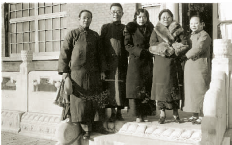
▲ 赵元任(左一)、杨步伟(左四)夫妇及侄女与胡适(左二)夫妇在胡适家门口。