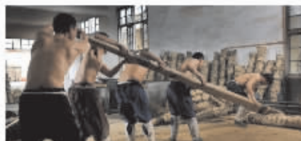
CCTV 新闻栏目报道安化黑茶千两茶制作工艺