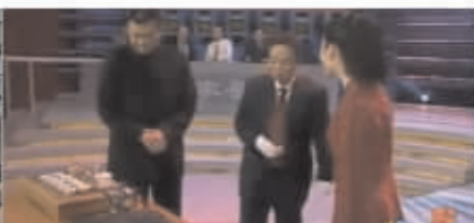
CCTV-2 《鉴宝》栏目鉴宝安化黑茶