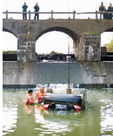
9日上午, 长沙市望城区报母桥, 消防队员正在打捞事故车辆。

当地市民黄先生分析, 该路段夜间车辆较少, 事发时事故车辆“可能车速过快, 要急转弯时, 没反应过来。”黄先生指着地面说, “这里连刹车痕迹都没有。”(杜先生提供线索, 奖励30元)