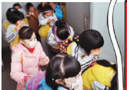
12月7日，湖南省消防防灾教育馆，小学生们在体验火场疏散。