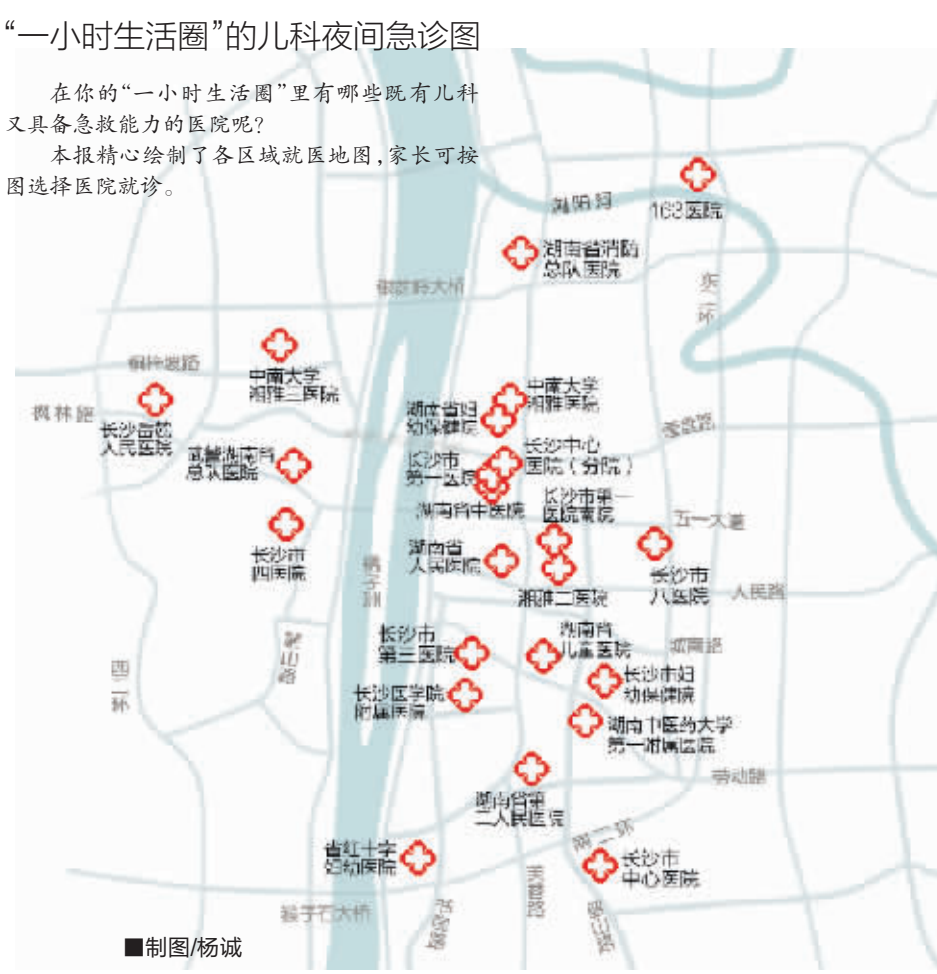
“一小时生活圈”的儿科夜间急诊图

在你的“一小时生活圈”里有哪些既有儿科又具备急救能力的医院呢? 本报精心绘制了各区域就医地图,家长可按图选择医院就诊。