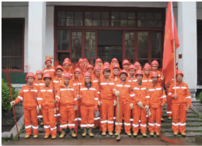
新化林业局整装待发的森林防火应急分队。

新化县林业局的负责人表示，将以“绿化新化四年行动计划”为发展契机，将道路绿化、林带绿化、水系绿化、特色绿化、空闲地绿化等建设列入重点增绿项目，不断增长森林资源，稳步提升生态环境，“力争实现有山皆绿，有水皆清，一条通道一条绿色走廊，一座城市一片森林，一个村庄一座绿岛的生态画卷。”