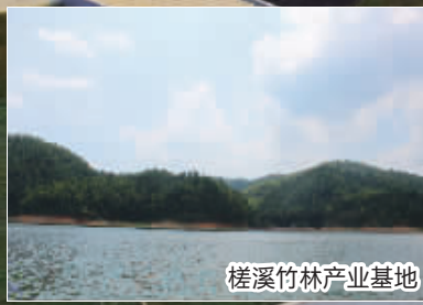
槎溪竹林产业基地