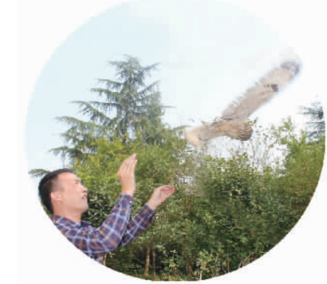
放生国家二级保护动物猫头鹰。