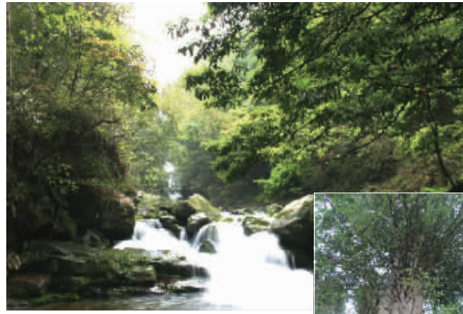
上图为溪边造林 右图为槎溪镇720年红豆杉

植物品种104个。目前，已完成工程总量的80%以上，整体绿化任务可按期圆满完成。新化县全面启动了城市森林生态圈建设，上梅东路、梅苑路、学府南路等公共地段绿化基本补栽到位，共新栽街道树140余株、小苗木20余万株、草皮30000余平方米、草地砖60000余平方米，更换已损坏的绿化隔离栏1000余米，城区绿化水平得到了明显提升。洋溪、白溪、水车等乡镇的小城镇绿化因地制宜，设计科学，布局合理，凸显乡村绿化特色，示范效应明显。