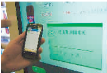
市民正在使用“当面付”购买物品。 资料图片