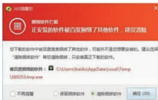
网民在百度安全官网下载百度卫士,360给予红色弹窗警告,提示“建议清除”。