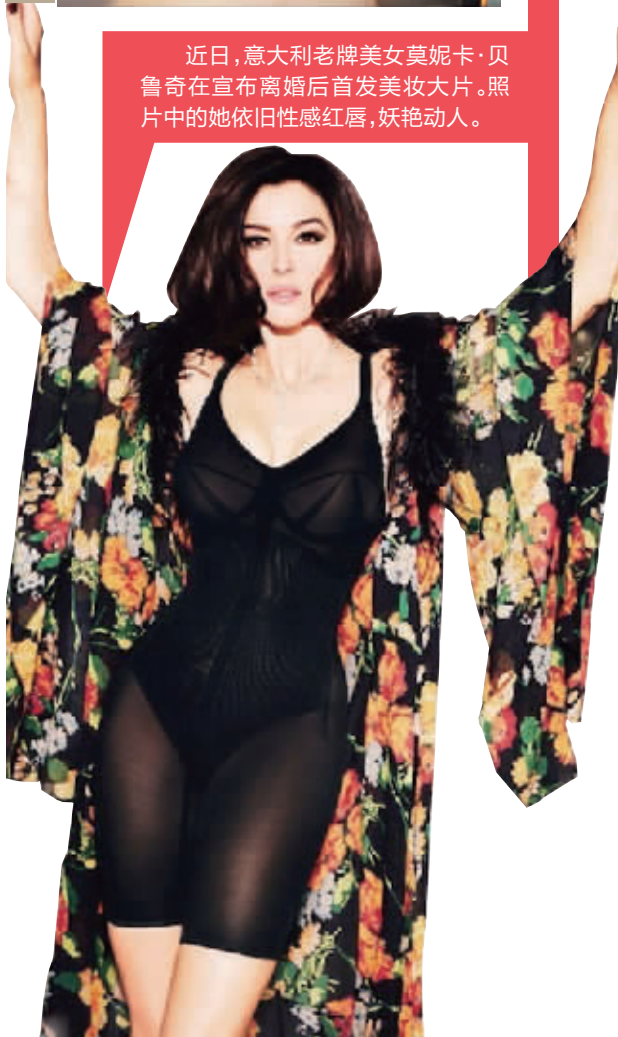
近日,意大利老牌美女莫妮卡·贝鲁奇在宣布离婚后首发美妆大片。照片中的她依旧性感红唇,妖艳动人。