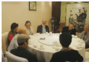
10月23日, 省委招待所, 成都理工大学56级的同学们在饭前聊起来。