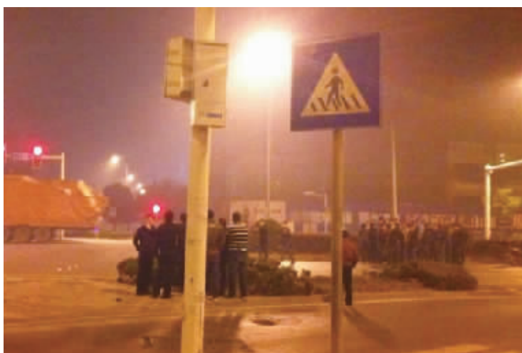
23日凌晨,一辆小车撞飞3名大学生后逃逸,众多好心路人筑“人墙”守护现场两小时。