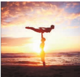
照片说明为“( ^ . ^ ) /”