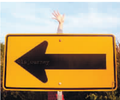
照片之说明为“( ^ - ^ ) /”