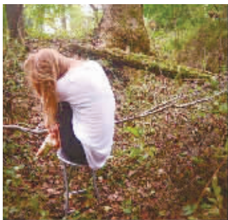
照片说明为“( _ _ )”