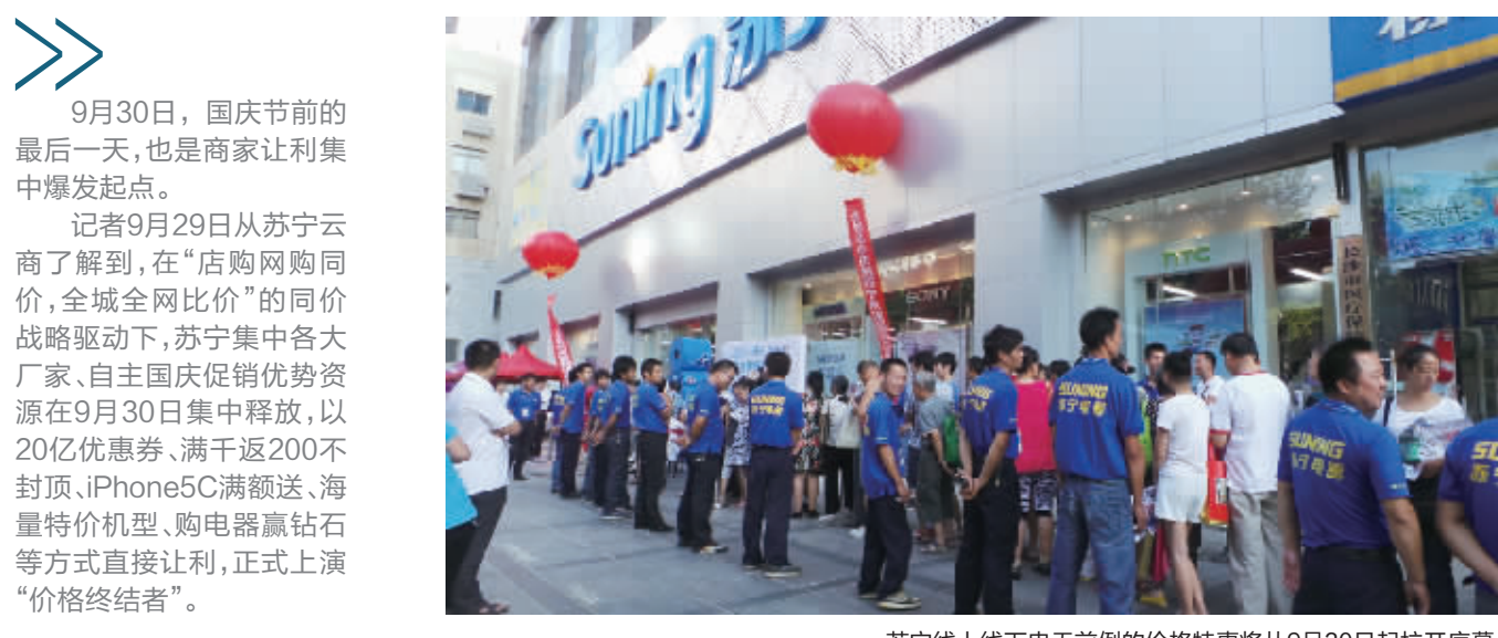
苏宁线上线下史无前例的价格特惠将从9月30日起拉开序幕。