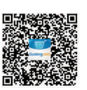
苏宁无线 随时随地畅享

作为消费者最爱网购的百货家居美食类,苏宁易购此次在9月30日之前,推出进口零食、婚庆零售每满99元减20元,名酒品牌大促全场0元减抢,茅台专场满200元减100元;阳澄湖大闸蟹同款单品2件买一送一;家纺、家居满300元减100元;纸品第二件半价。9月30日-10月7日,苏宁易购红孩子大促,母婴8大品类满288减100,奶粉专场满488减100;9月30日图书专场直降活动最后1天。