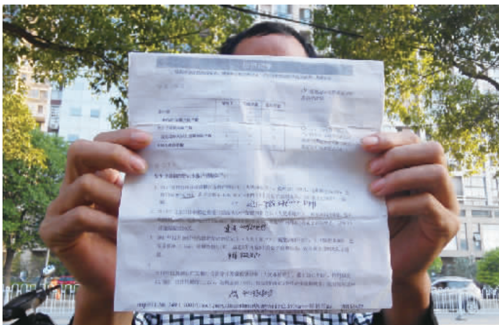
陈先生提供的巨额催款通知单。

也未借出过身份证。只有2011年11月,陈军与朋友一起去中国邮政银行办理过信用卡。