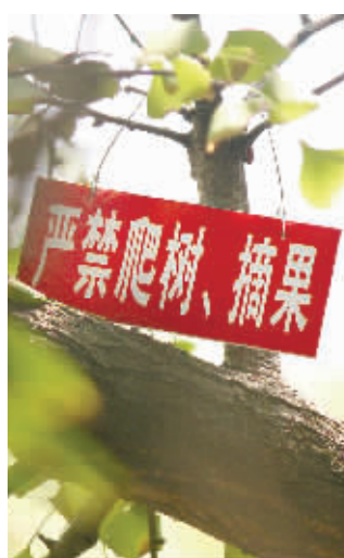
长沙市桂花公园的银杏树上挂着“严禁爬树、摘果”的小红牌。