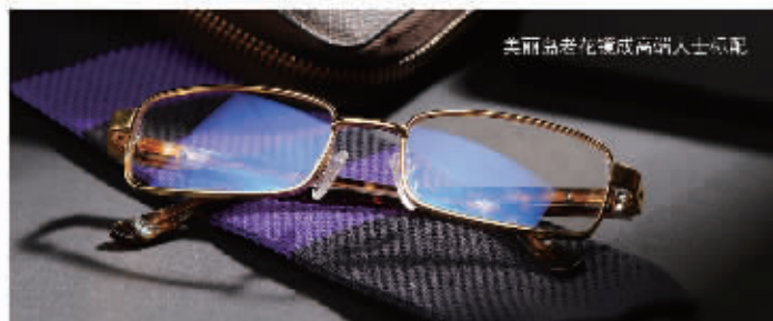
美丽岛老花镜成高端人士标配

“不管是在办公室阅读文件、上网、看电视，还是开会、出差，一副美丽岛足够了，看远看近都清晰舒适，方便。”自称最敬业的