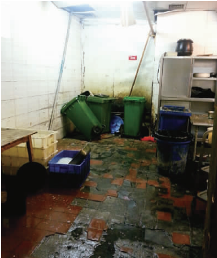
▲长沙王府井百货7楼某餐厅厨房污水横流。

开福区交警支队工作人员称,合规的安全出口应该标志清晰、显眼,不能用广告遮挡。“火灾常常伴随着停电,如果安全出口不显眼,顾客会很难以找到赖以求生的逃生门。”该工作人员称。