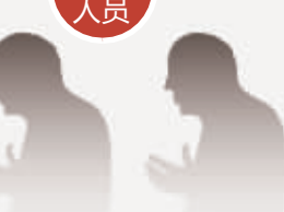
其余2名均为尔玛公司员工