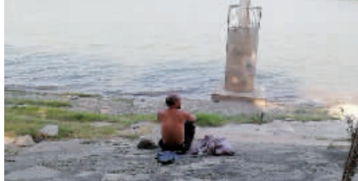
坐在江边的阴凉处吹吹风。