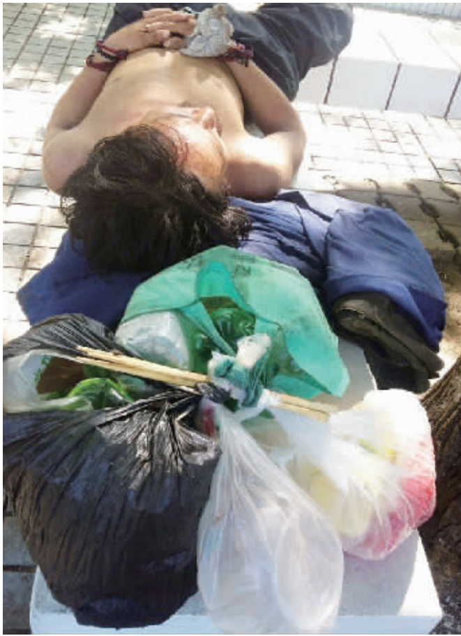
8月8日, 流浪汉“老小伙”累了就回橘子洲大桥下休息, 这里放着他的所有家当: 一副碗筷、几件衣服。