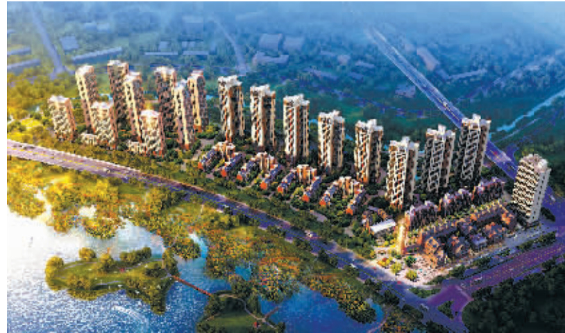
万科·白鹭郡将代表“湘江系”首先发声。