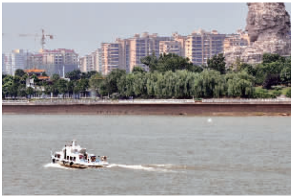
水警的日常工作不仅是110值班、走访,还需经常去辖区内巡逻。