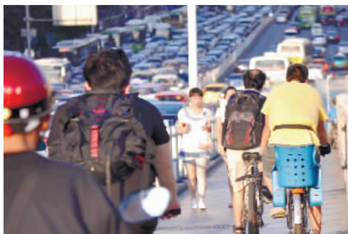
7月9日下午5时,长沙市橘子洲大桥拥堵不堪,与堵车长龙形成鲜明对比的是桥上骑行自如的市民。

对于即将到来的自行车时代,虽然可能会碰到一些现实的阻碍和推进的难度,但记者在调查过程中发现,绝大多数市民还是抱有美好的期盼,这也是城市治理、倡导绿色出行的趋势。本报将联合倡导绿色出行的骑友们组织“单行之城”先行者活动,如果你想参与可拨打96258报名。