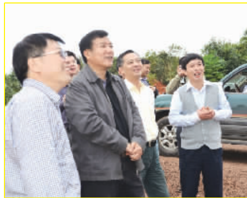
水利部副部长矫勇(左二)、湖南省人民政府副省长张硕辅(右二)听取公司总经理文柏海汇报。