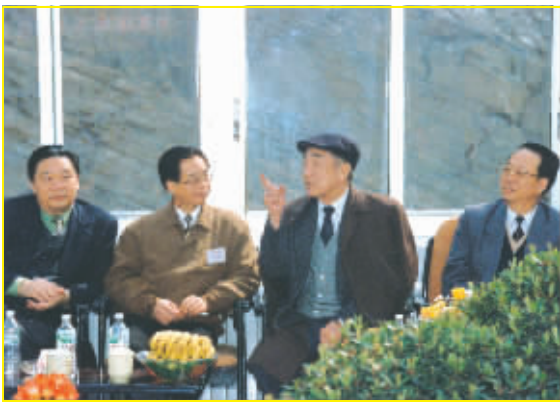
1996年4月6日,时任国务院副总理邹家华(右二)及国务院有关部门、省委省政府领导视察江垭水库。