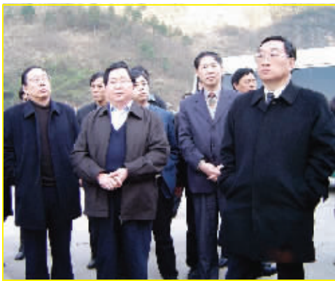
水利部部长陈雷(右一)视察皂市水库。