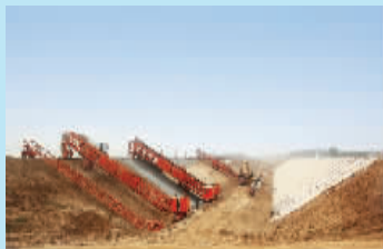
南水北调中线工程鹤壁段代建项目。